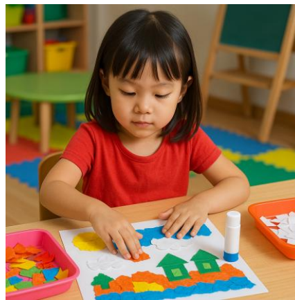
Gambar 2. 1 Contoh Gambar Kegiatan Montase

Dari pendapat di atas dapat disimpulkan bahwa montase merupakan salah satu bentuk karya seni visual yang diciptakan dengan cara menyusun dan menempelkan potongan-potongan gambar dari berbagai media cetak seperti majalah, koran, atau buku, menjadi satu kesatuan komposisi baru yang memiliki makna. Kegiatan ini tidak hanya bernilai estetis, tetapi juga memberikan ruang bagi anak untuk mengekspresikan imajinasi dan kreativitasnya secara bebas. Proses penyusunan gambar-gambar tersebut juga membantu anak memahami konsep visual, membangun cerita, serta melatih koordinasi motorik halus dan daya cipta mereka.