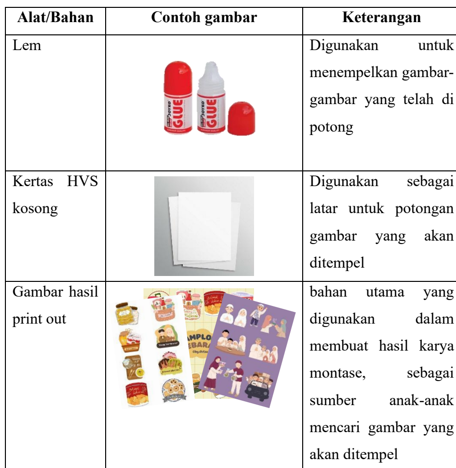
Tabel 2. 1Alat dan Bahan Kegiatan Montase

Kegiatan montase membutuhkan alat dan bahan untuk melaksanakan kegiatannya, diantaranya adalah (Novidewi, 2017):