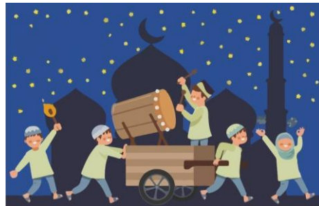
Gambar 2. 4 Menyusun Gambar Sebelum di lem

yang ingin dibangun. Dalam proses ini, diperlukan konsentrasi dan pertimbangan yang matang sebelum gambar ditempel, terutama dalam hal penataan dan ukuran masing-masing gambar. Anak perlu mengeksplorasi letak dan skala gambar secara kreatif agar tercipta sebuah susunan yang tidak hanya menarik secara estetika, tetapi juga mampu menyampaikan tema atau cerita secara utuh dan jelas.