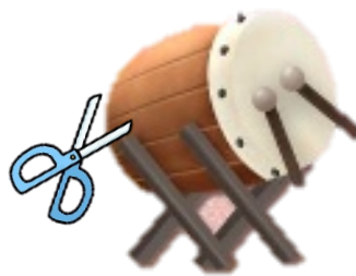
Gambar 2. 3 Menggunting gambar bedug sesuai pola