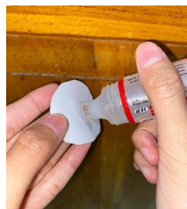
Gambar 2. 5 Mengoleskan lem pada gambar