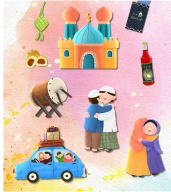
Gambar 2. 2 Kumpulan Gambar Untuk Tema Idul Fitri